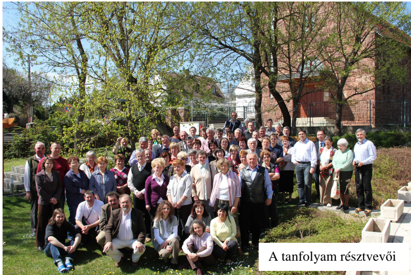
A tanfolyam résztvevői

Istennek hálát adva számolhatunk be arról, hogy múlt év őszén és idén tavasszal 2-2 napos képzésen vehettünk részt országos egyházunk Révfülöpi Oktatási Központjában.