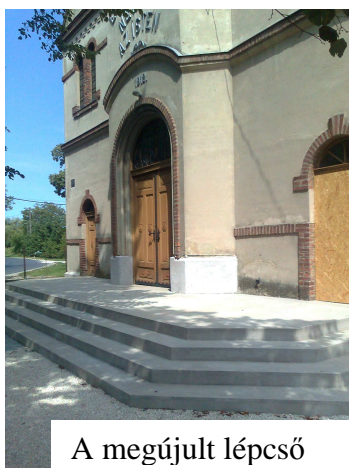
A megújult lépcső