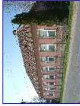
Gyónó - iskola