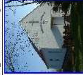
Zsebeháza - templom