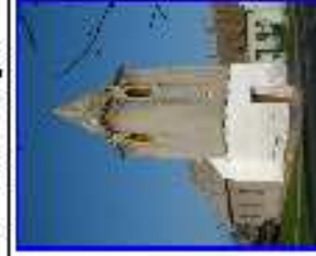
Pátyond - templom