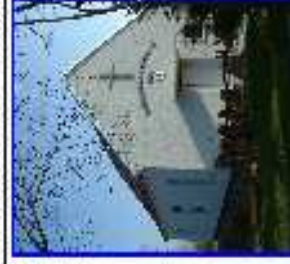
Zsebentő - templom