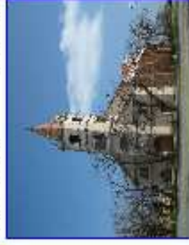
Vadosfa - templom