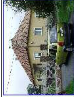
Vadosfa - parókia