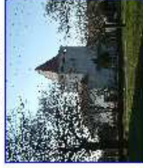
Mátyásföld - templom