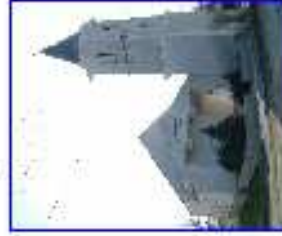
Kisbuda - templom