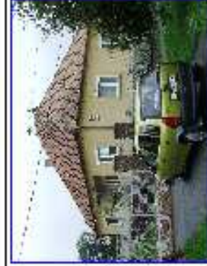
Vadosfa - parólia