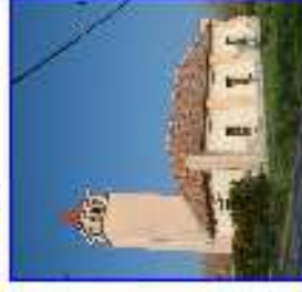
Ménfőcsanak - templom