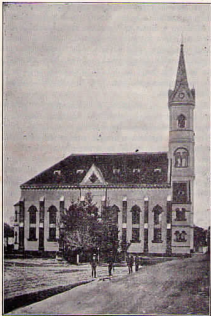
A vadosfai új templom.

még áll hazánk s egyházunk. A hitszabadságért hevülők törhetlen hűsége végül kivivott annyit, hogy azon vármegyékben, amelyekben egy evang. templom sem maradt, az országgyűlés két helyen — Sopron megyében névszerint, Nemeskőren és Vadosfán — engedte meg ennek építését. E vidék evang. lakosai késedelem nélkül felhasználták az engedélyt a veszteség