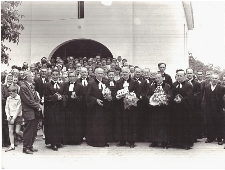
Keresztyén gyülekezet, kedves testvéreim az Úr Jézus Krisztusban!

Különleges ünnep, különleges alkalom ez a mai mind a vadosfai, mind a magyarkeresztúri gyülekezet életében.